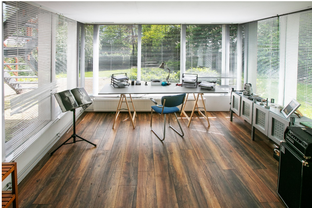
Werkkamer in souterrain