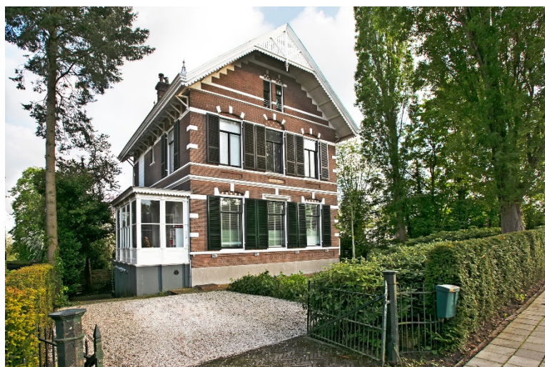
Hulkesteinseweg 35 te Arnhem