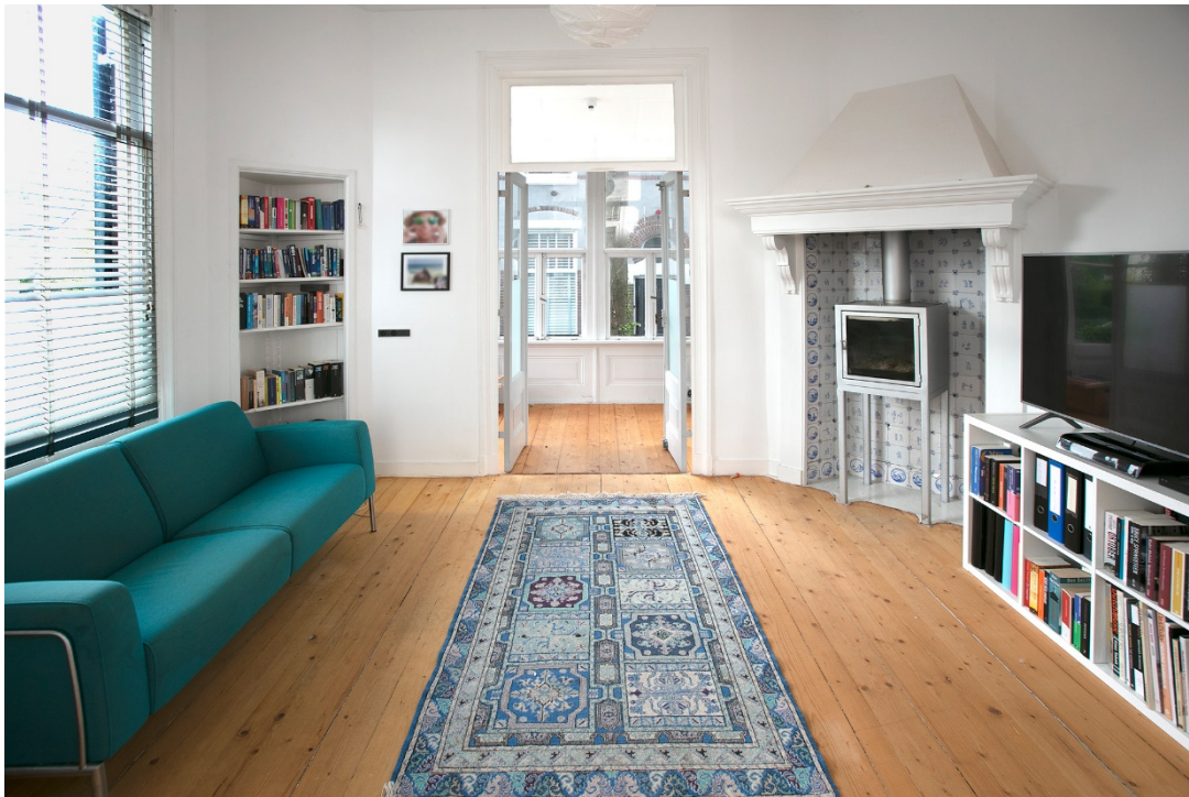
TV kamer met serre