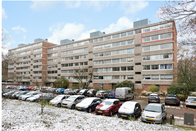
Beethovenlaan 247 te Doorwerth