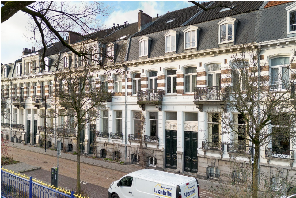
Spijkerstraat 233-I te Arnhem