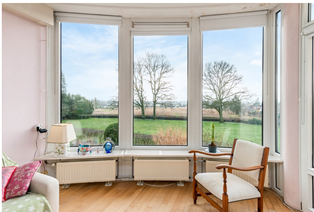
Woonkamer met fraai, vrij zicht