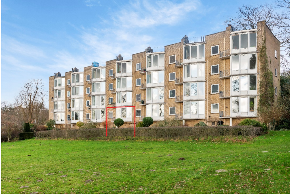
Fangmanweg 18 te Oosterbeek