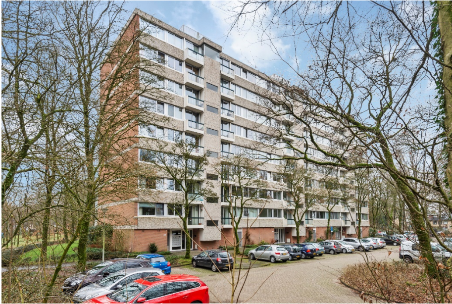
Kapelleboom 75 te Doorwerth