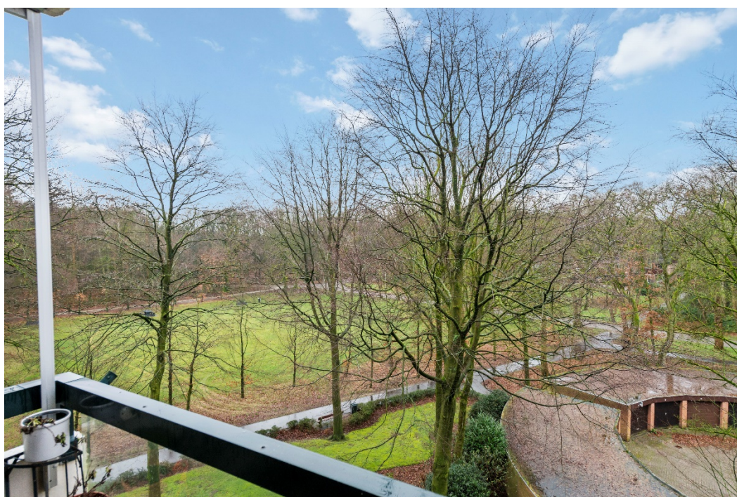
Uitzicht vanaf balkon