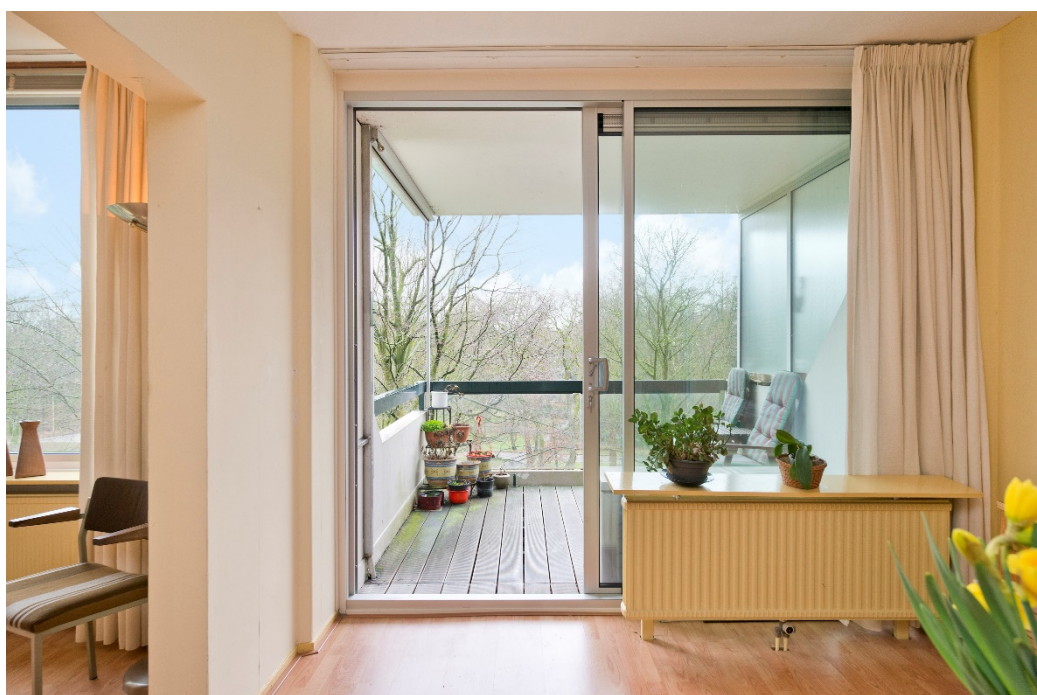
Zijkamer met balkon