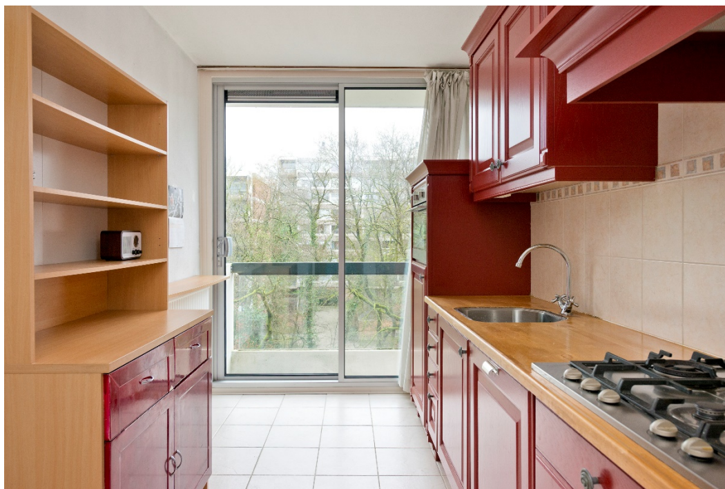
Keuken met 2 e balkon