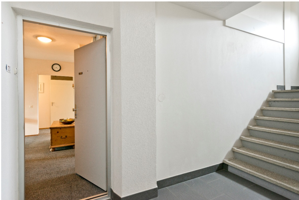
Entree voor het appartement