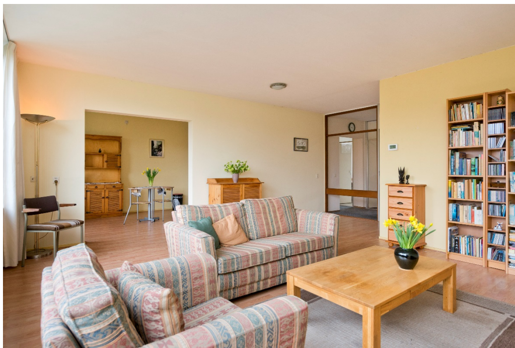
Woonkamer met zijkamer