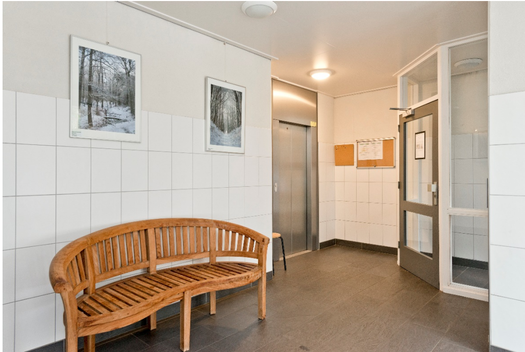
Centrale entree met lift en toegang tot trappenhuis