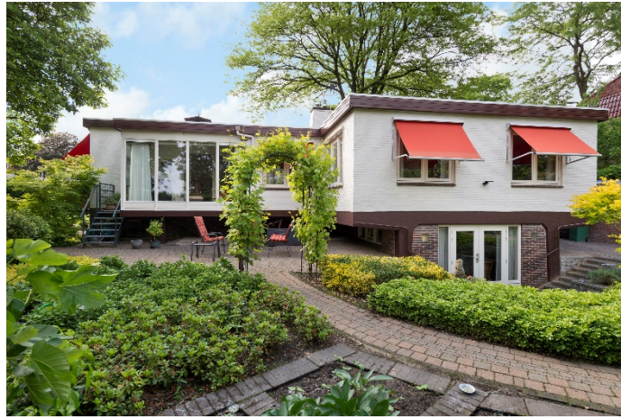
Jhr. Ned. van Rosenthalweg 28 te Oosterbeek