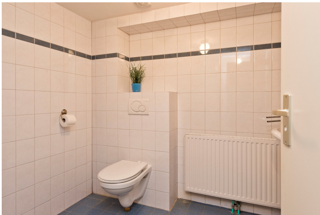
Badkamer 2 in souterrain

Jhr. Ned. van Rosenthalweg 28 te Oosterbeek