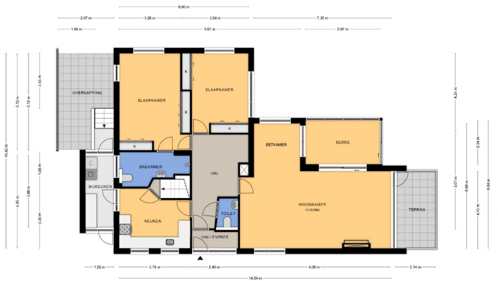
Jhr. Nedermeijer van Rosenthalweg 28 te Oosterbeek Begane grond

Aan de plattegronden kunnen geen rechten worden ontleend.