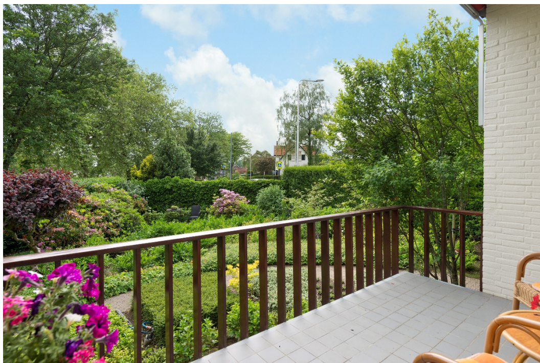
Zicht op tuin vanaf terras

Jhr. Ned. van Rosenthalweg 28 te Oosterbeek