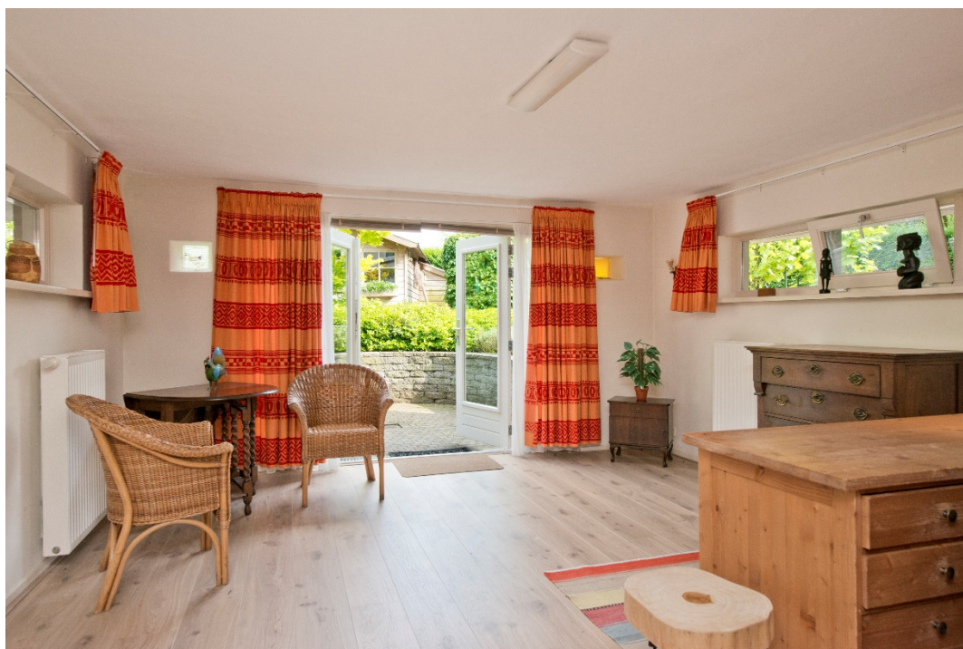
Slaapkamer 3 in souterrain