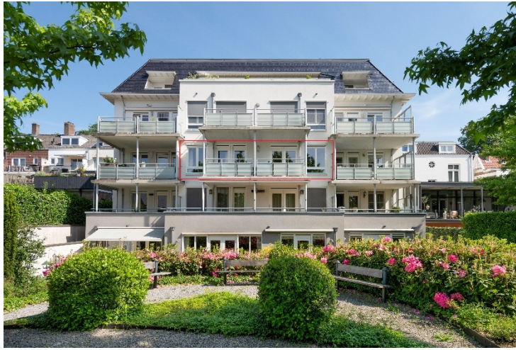
Utrechtseweg 198 H te Oosterbeek