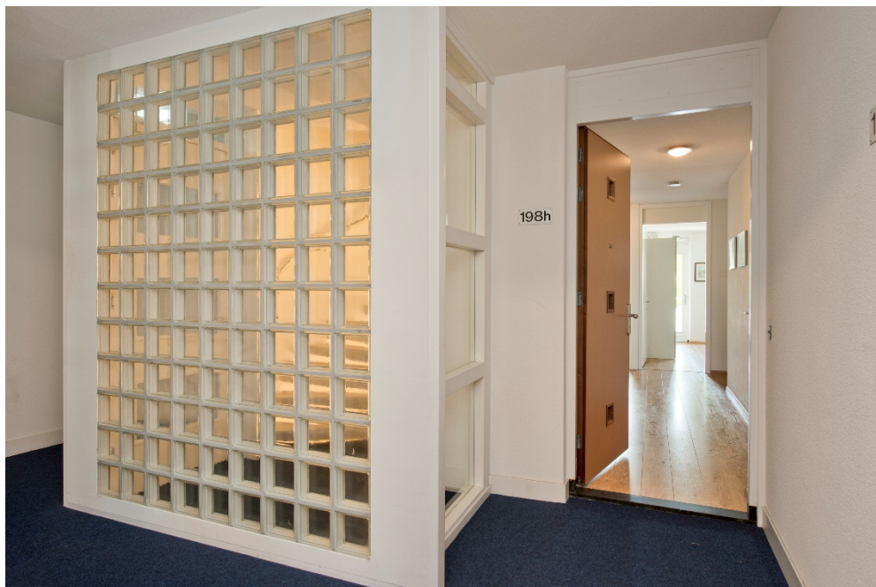
Entree/hal van het appartement