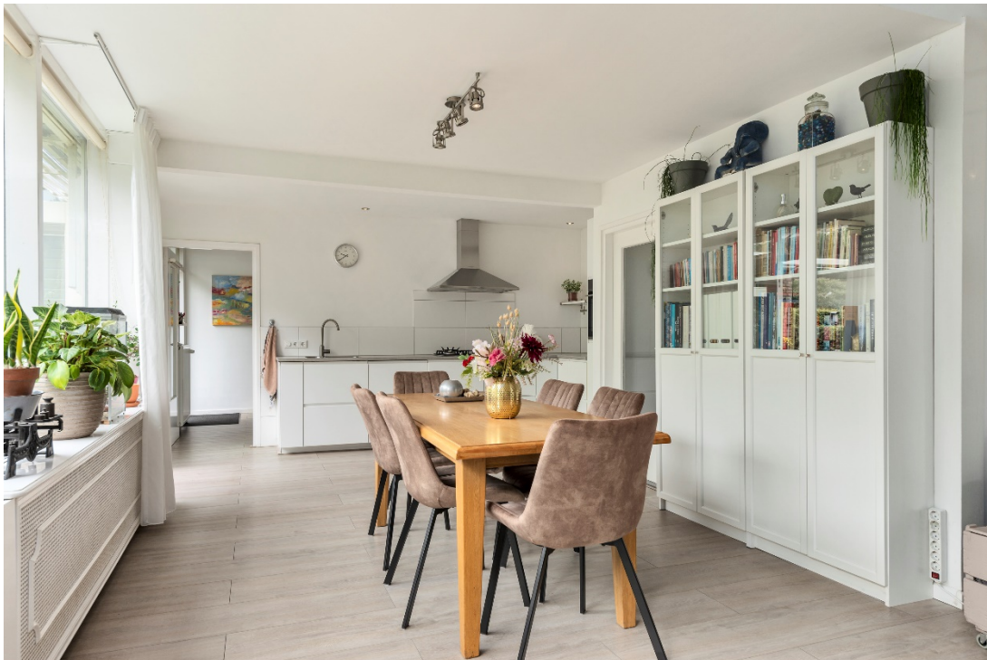
Eetgedeelte met open keuken