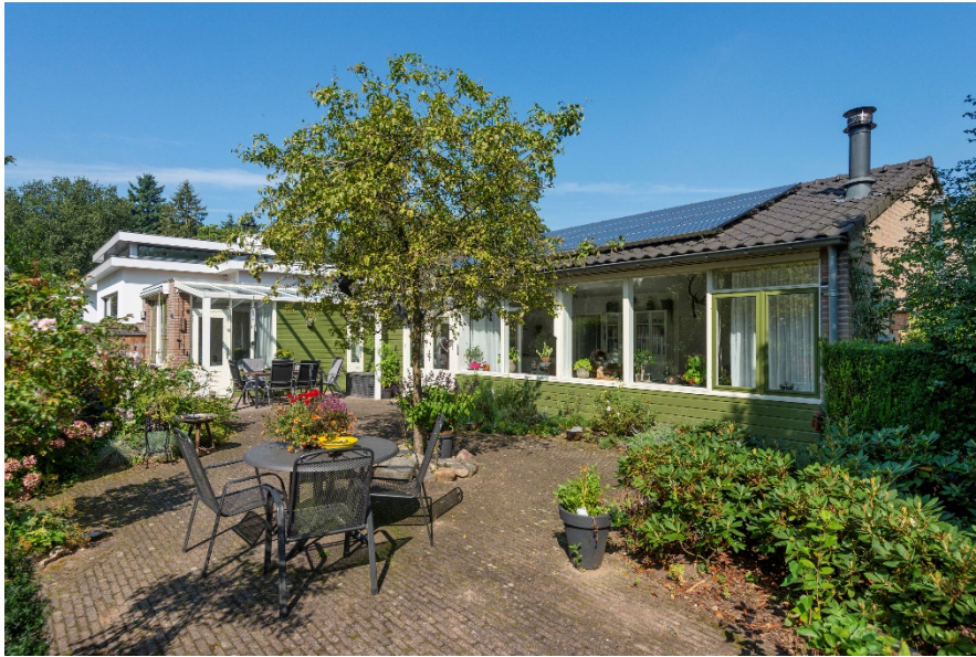
Beelaertsiaan 44 te Oosterbeek