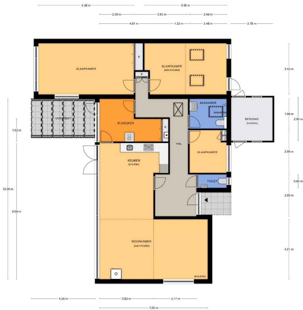
Beelaertsiaan 44 te Oosterbeek Begane grond

Alle de plattengronden kunnen geen rechten worden ontleend. © Toespraak vastgoedconsulentie