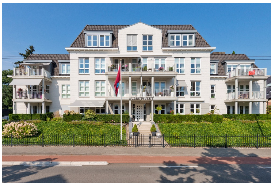
Raanhuisstraat 49 te Oosterbeek