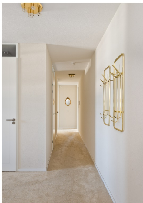
Hal met toilet