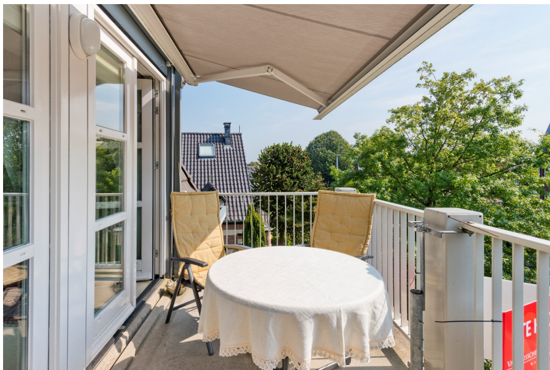
Zonneterras op het zuiden