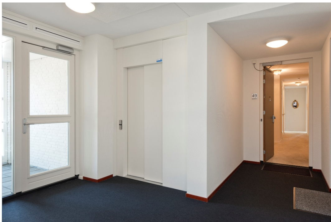
Hal woonverdieping met lift en trappenhuis