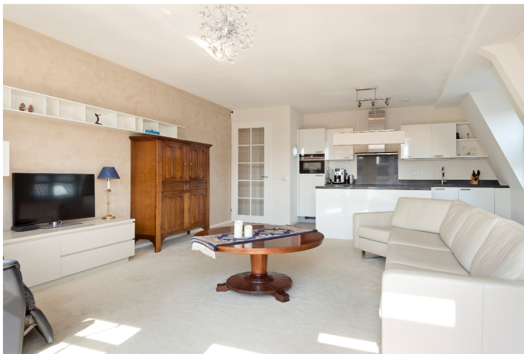
Woonkamer met open keuken