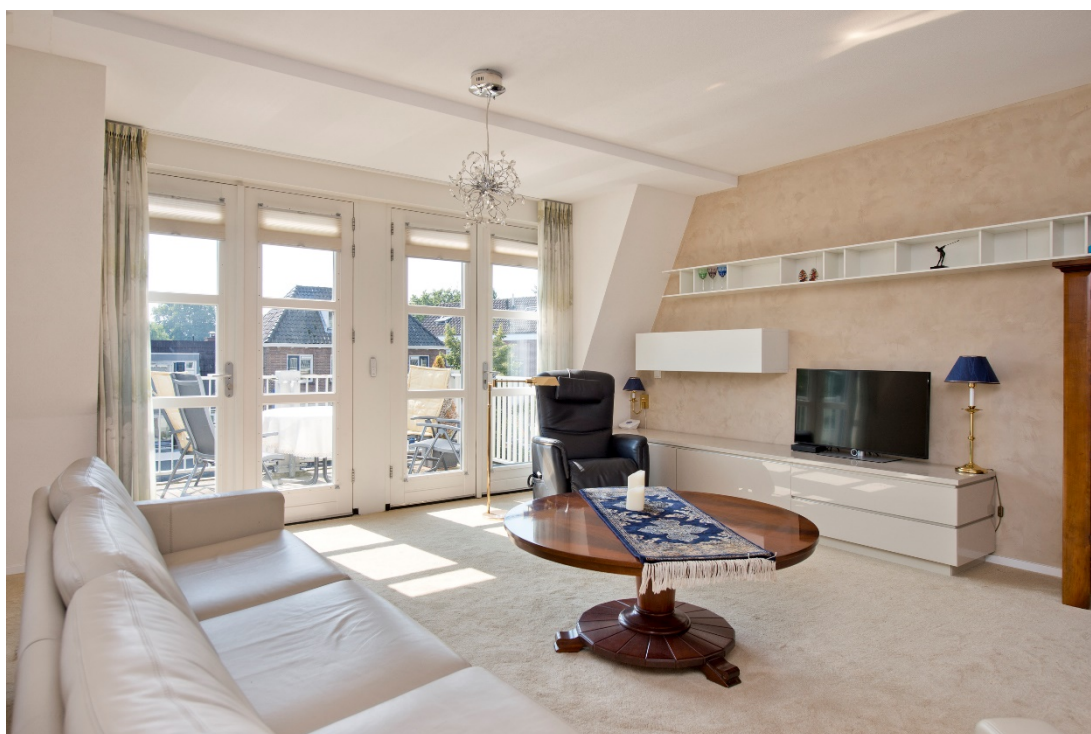
Woonkamer met openslaande deuren naar zonnig terras