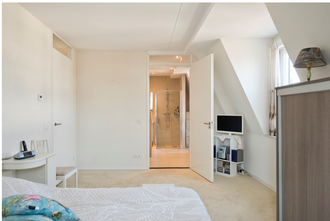
Slaapkamer met doorloop naar de badkamer (tevens vanuit hal bereikbaar)