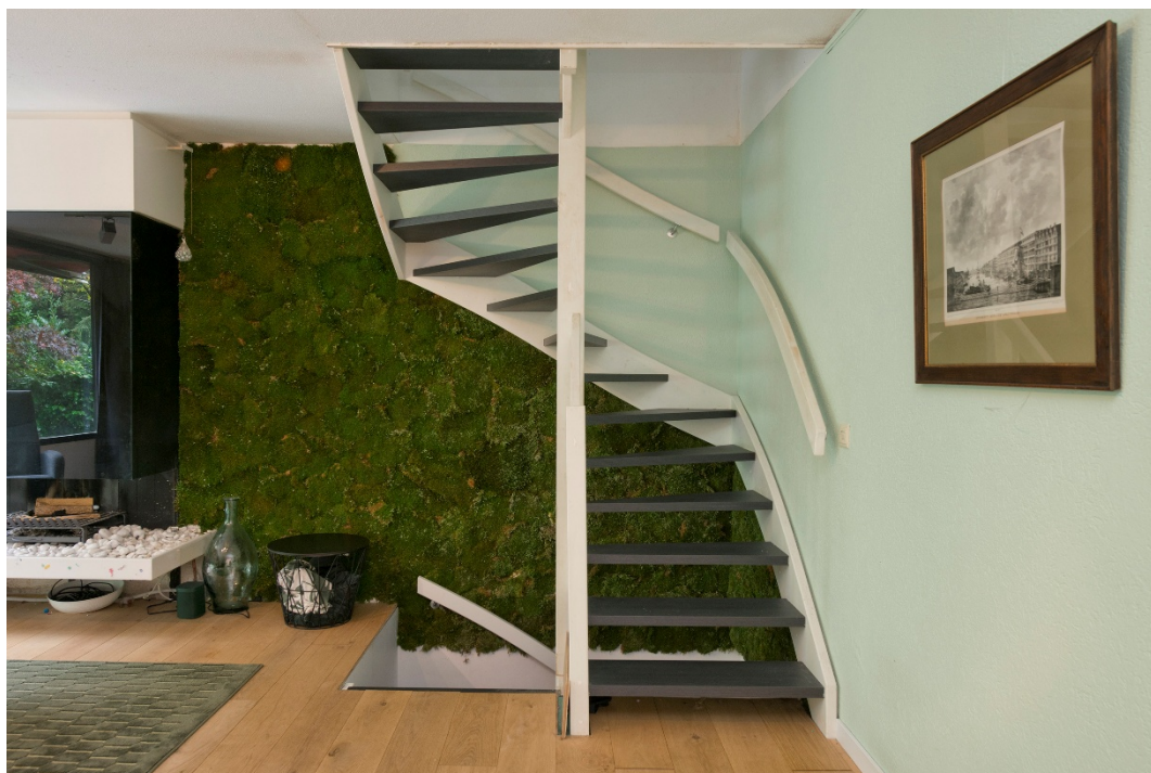
Trap naar eerste verdieping en souterrain