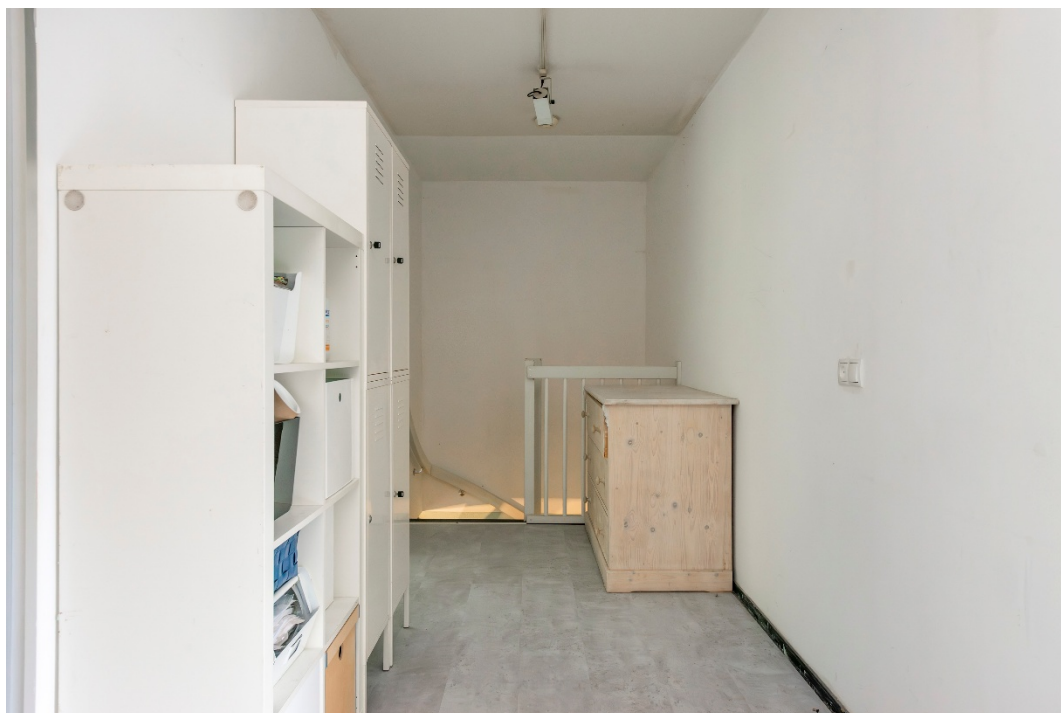
Overloop 1 e verdieping