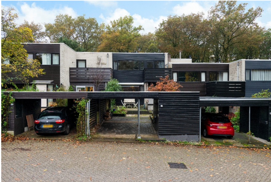
Beethovenlaan 150 te Doorwerth