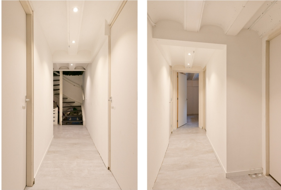
Hal in souterrain