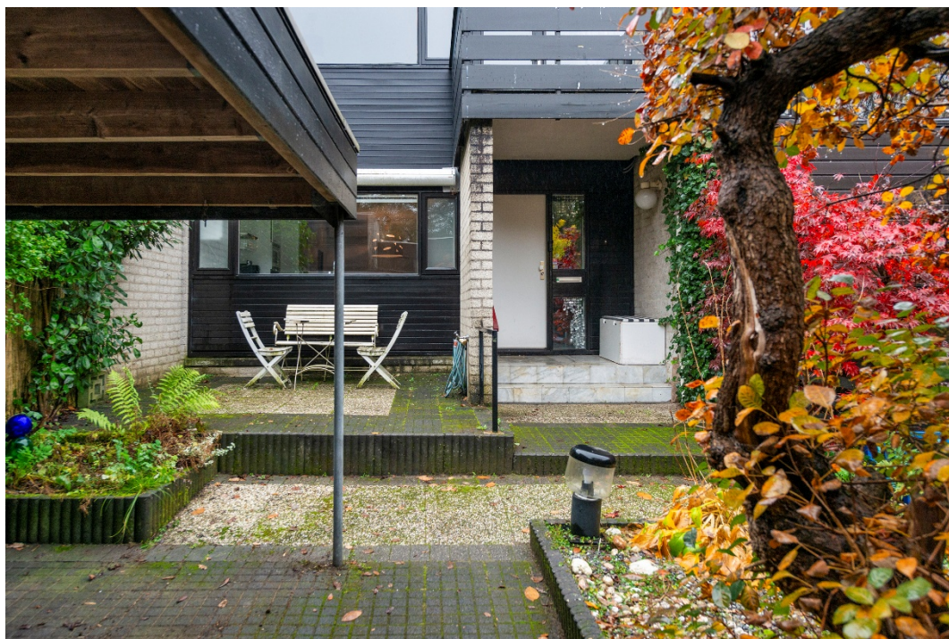
Carport, berging en voortuin