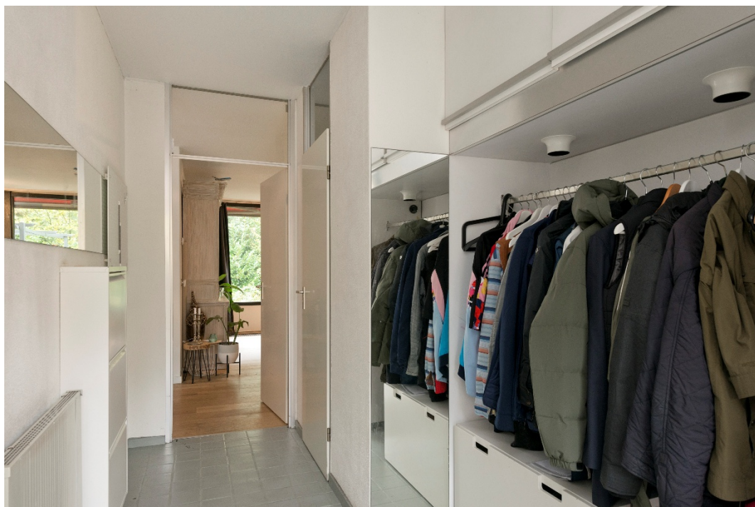
Hal/entree met garderobe en toilet