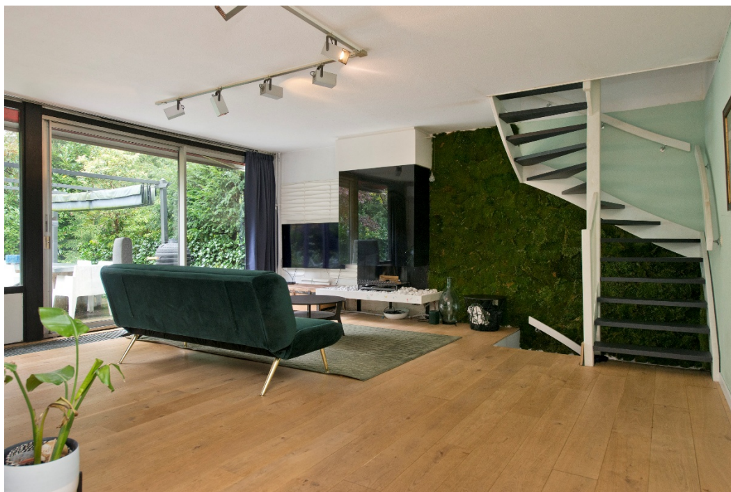
Woonkamer met haard en schuifpui naar de tuin