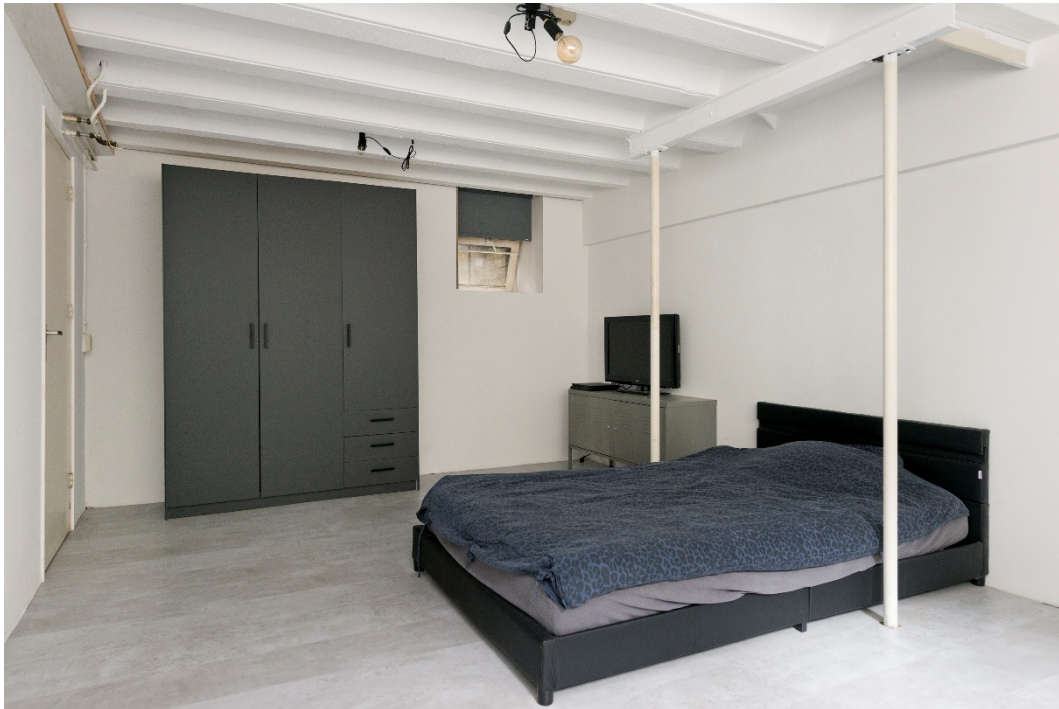
Souterrain met 2 ruime slaapkamers en hobbyruimte