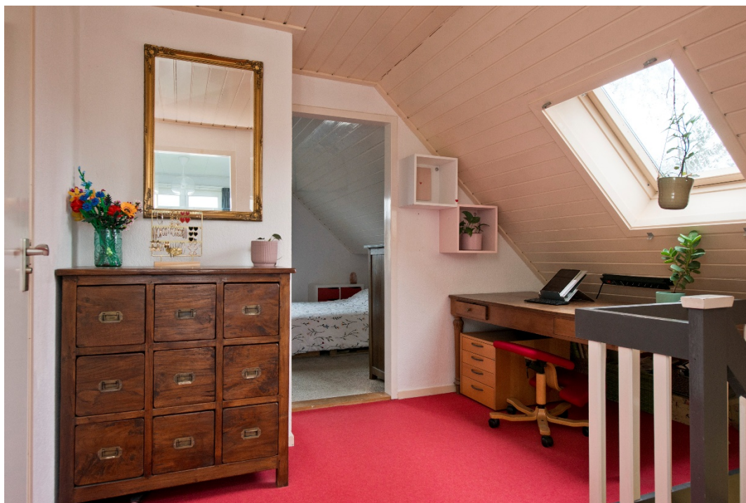
Overloop 2 e verdieping