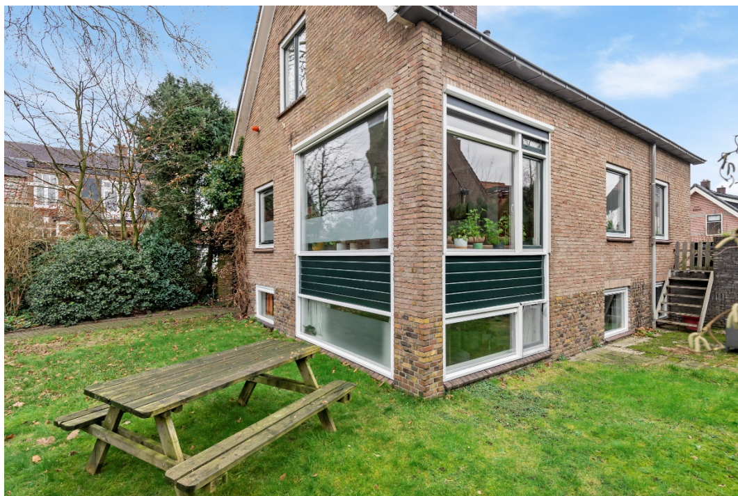
Voortuin en zijtuin