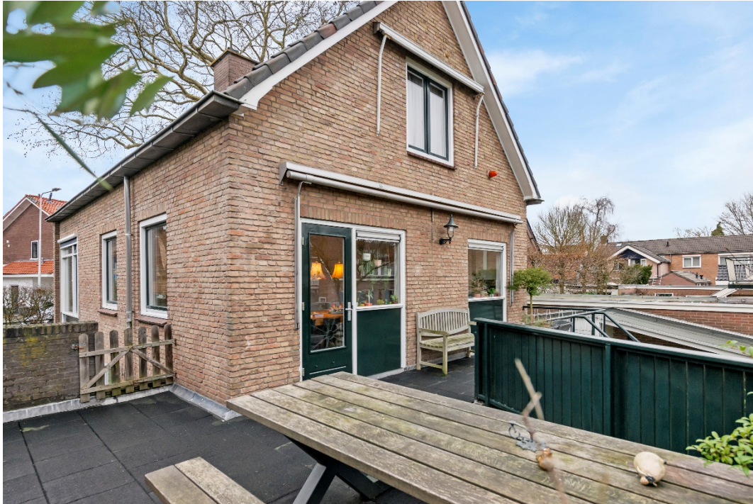
Terras vanuit keuken