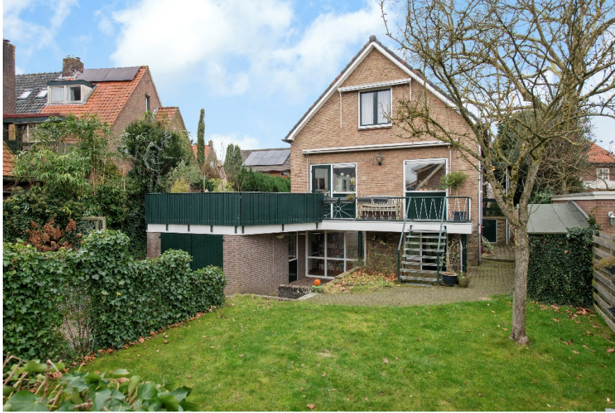
Steijnweg 19 te Oosterbeek