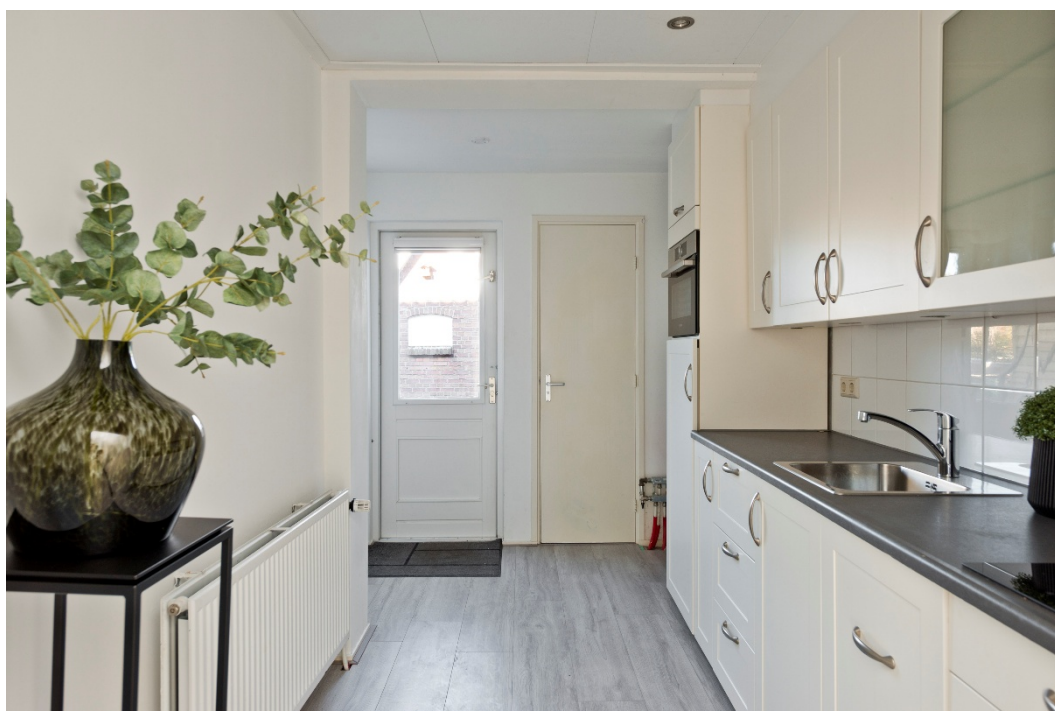
Entree in de nette keuken met toegang tot de badkamer en een slaapkamer