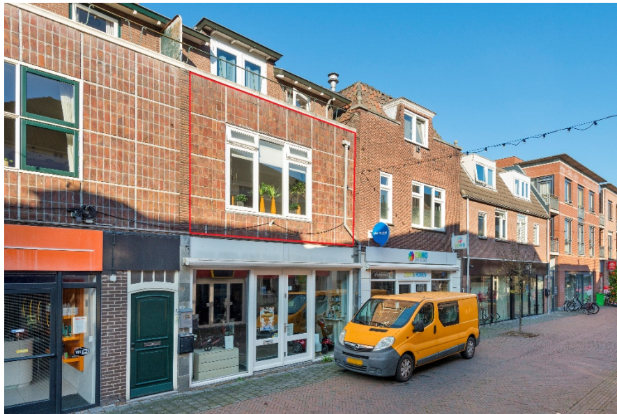
Dorpsstraat 71 A te Renkum