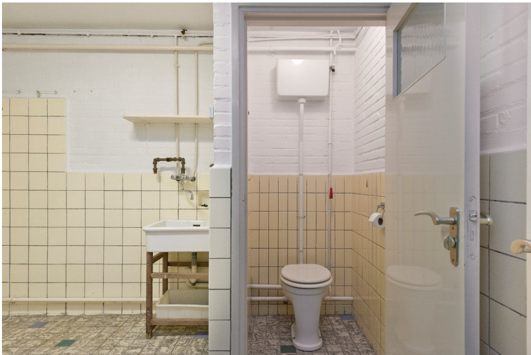
Berging 3 met toilet