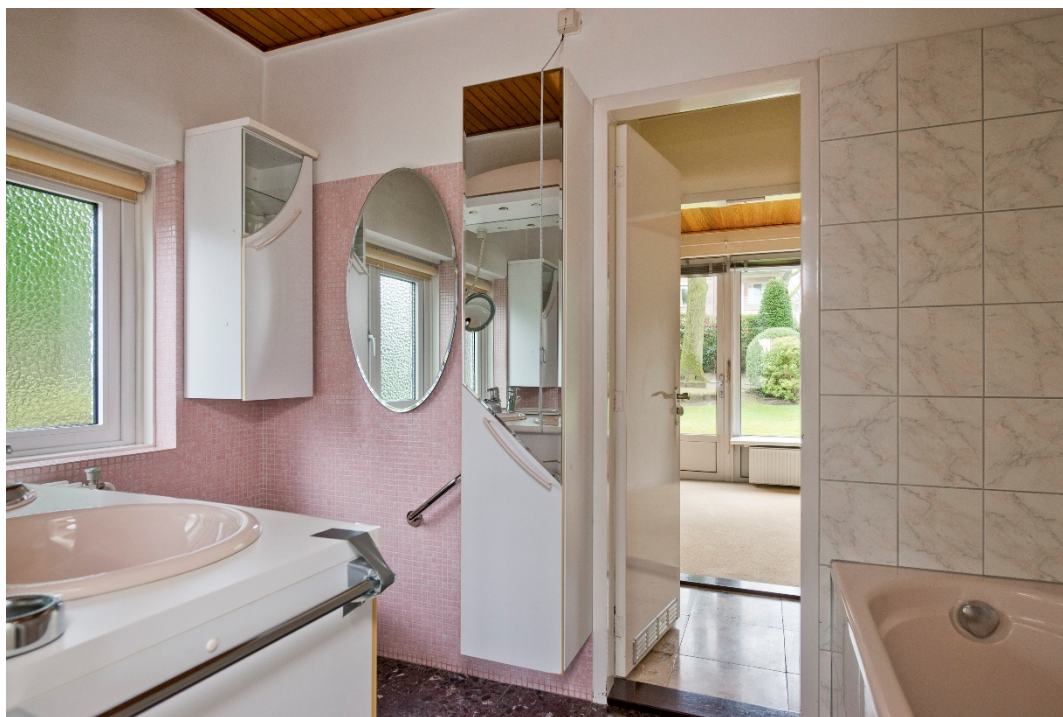
Badkamer op woonniveau