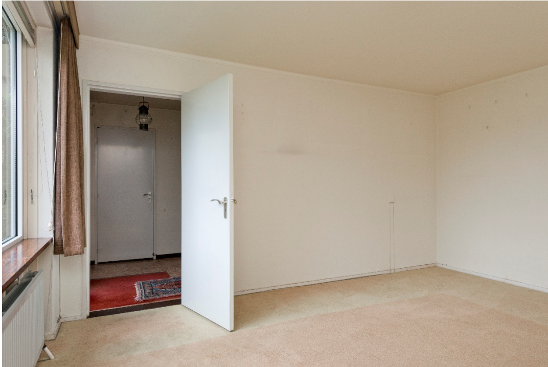
Slaapkamer 3 souterrain