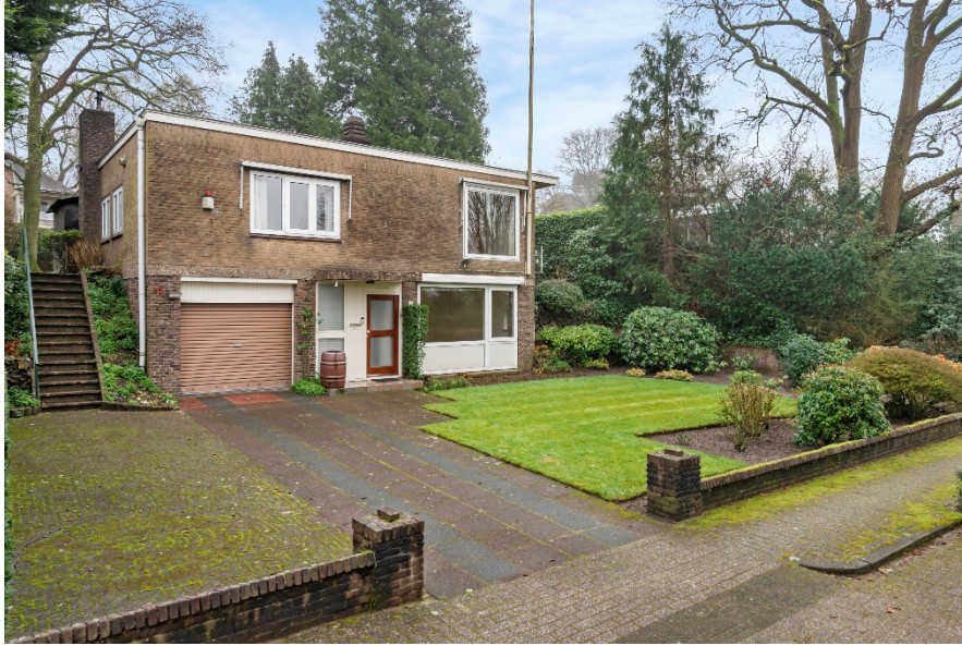
Rosandeweg 12 te Oosterbeek