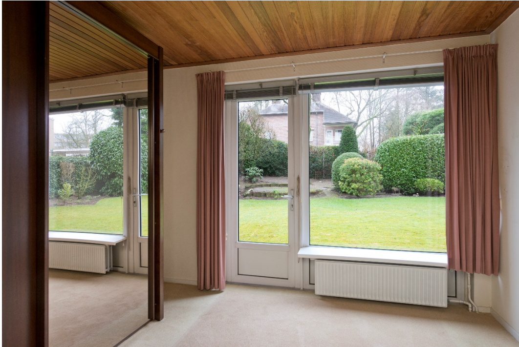
Slaapkamer 1 met deur naar de tuin