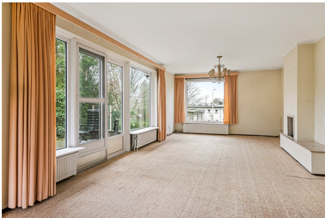
Woonkamer op achtertuintniveau