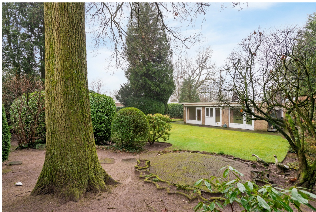
Diepe zonnige tuin