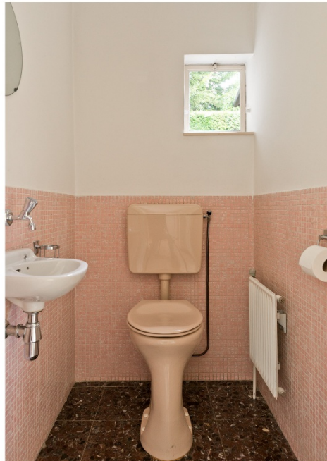
Hal woonverdieping met toilet