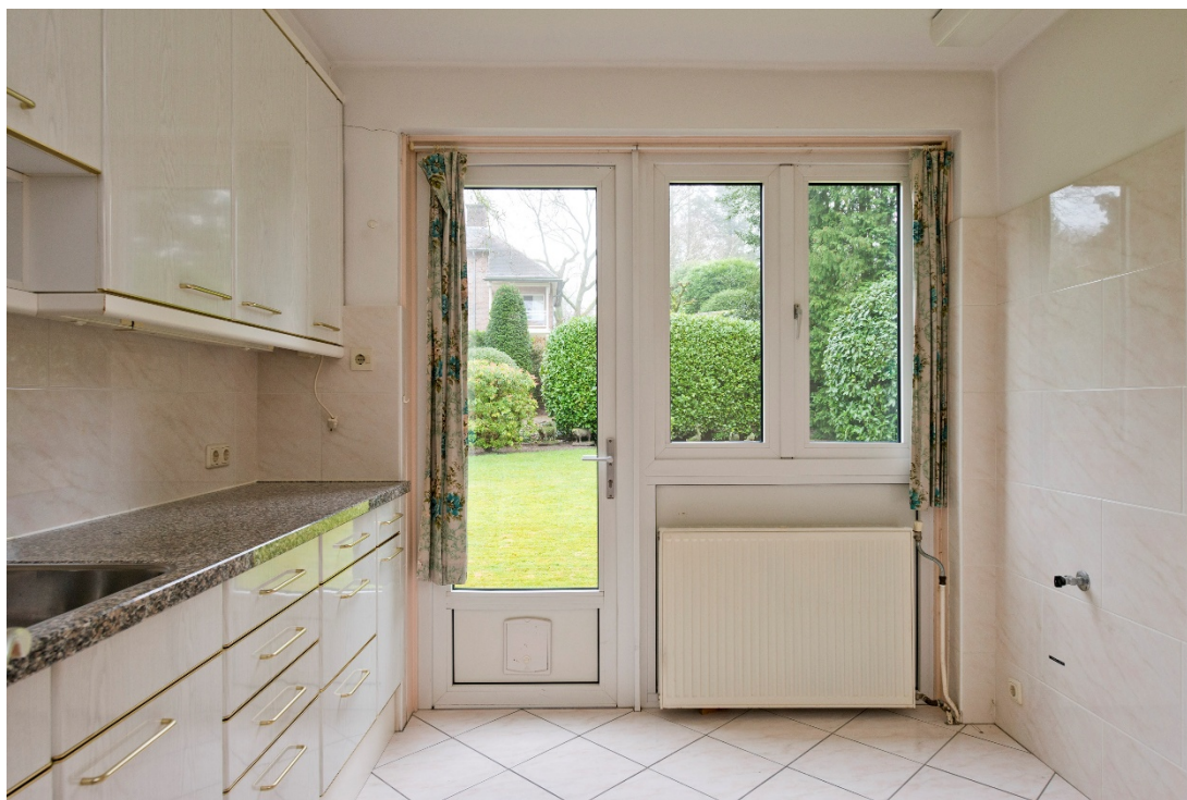
Keuken met deur naar de tuin