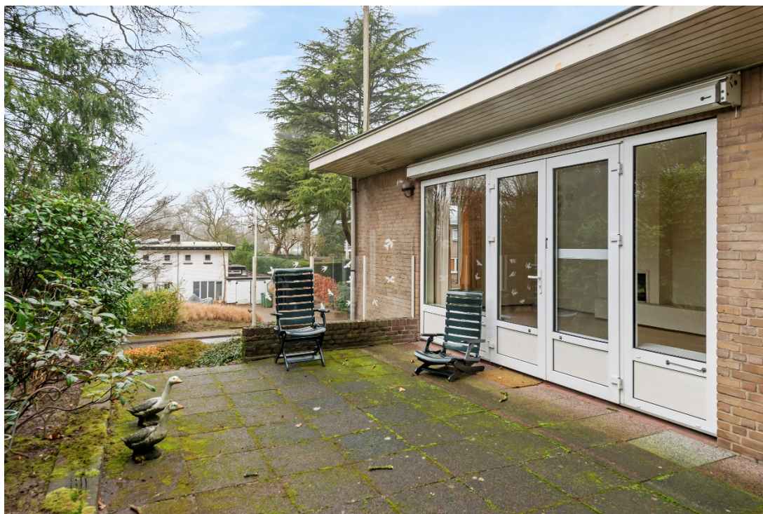
Terras bij woonkamer