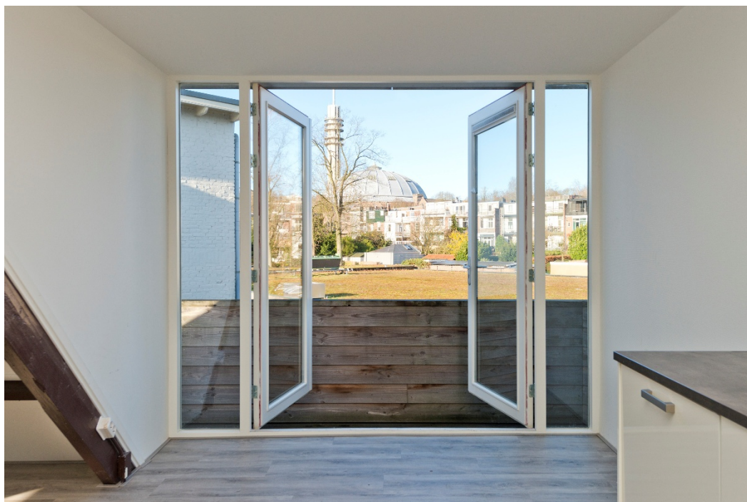
Openslaande deuren vanuit eetgedeelte met prachtig zicht richting De Koepel