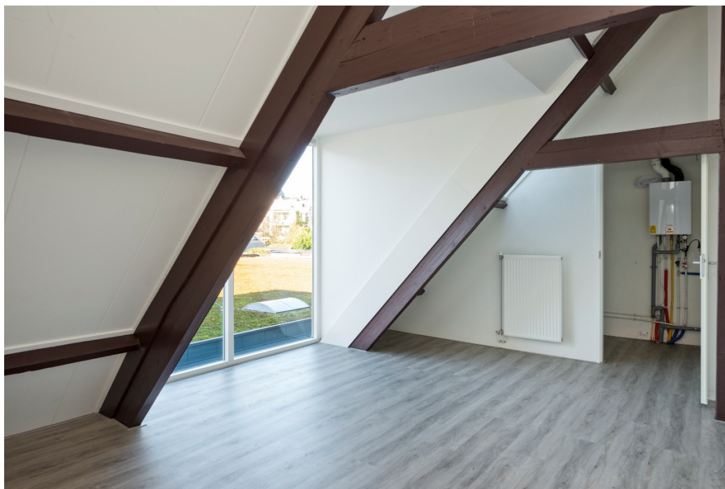
Slaapkamer met royale inloopberging