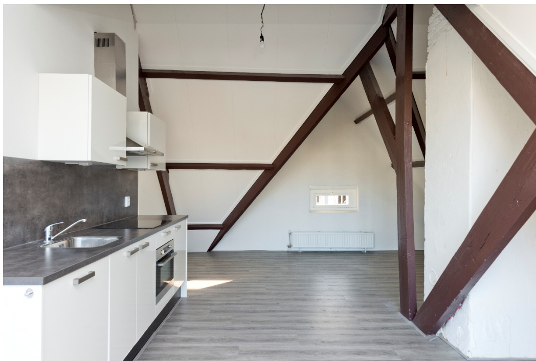
Eetgedeelte en woonkamer