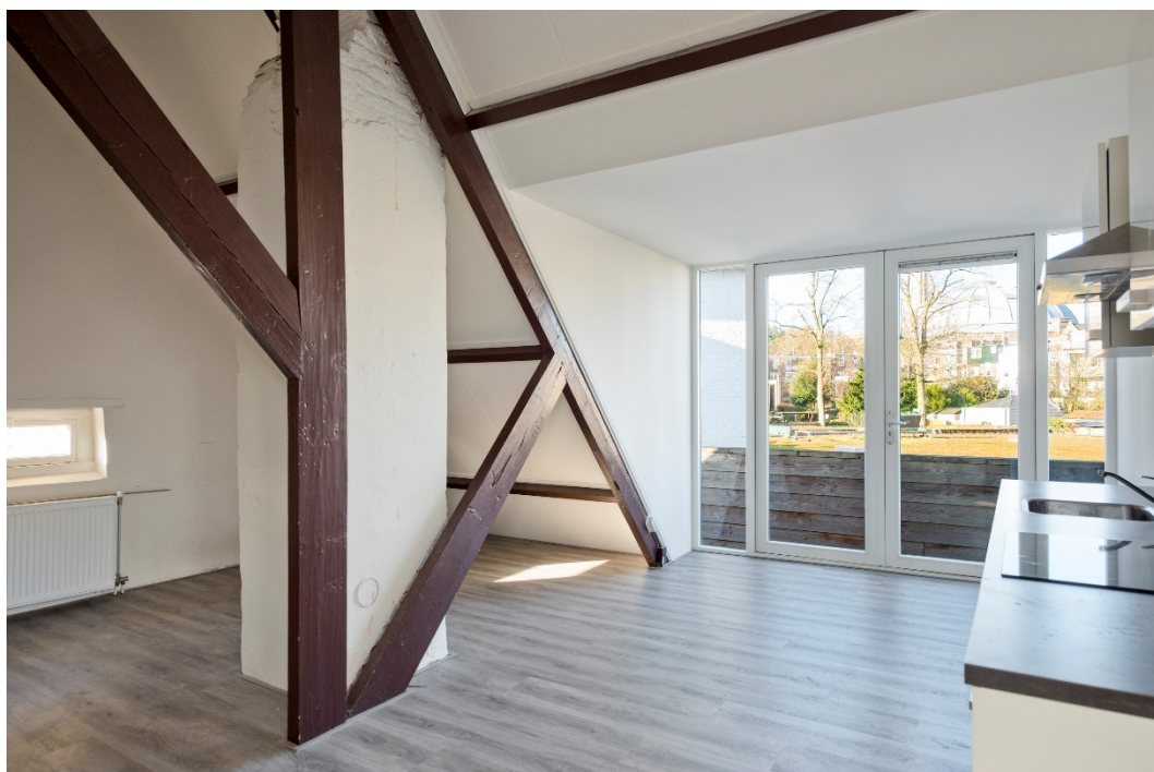
Vanuit de keuken/eetgedeelte toegang tot het balkon