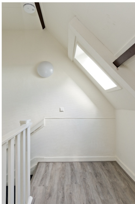
Trappenhuis en overloop