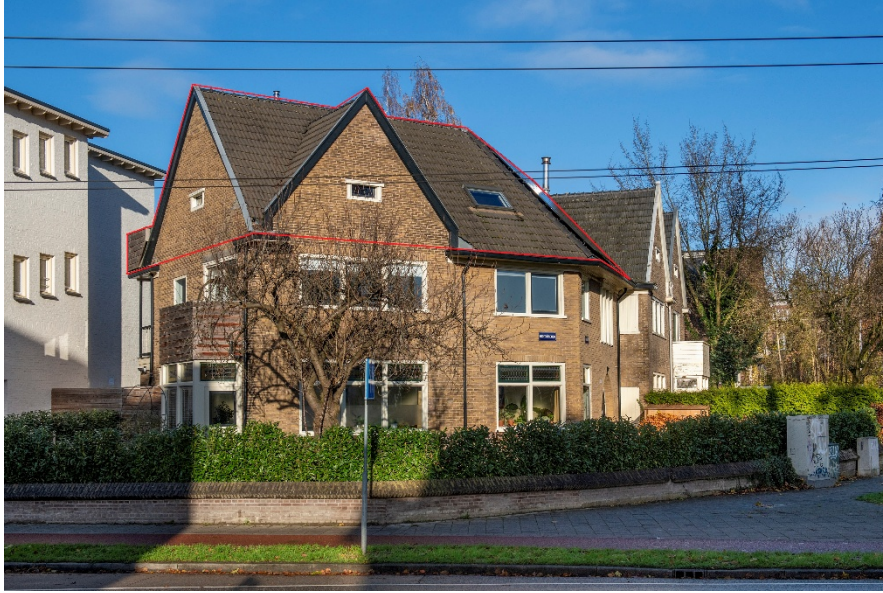
Oranjestraat 123-2 te Arnhem