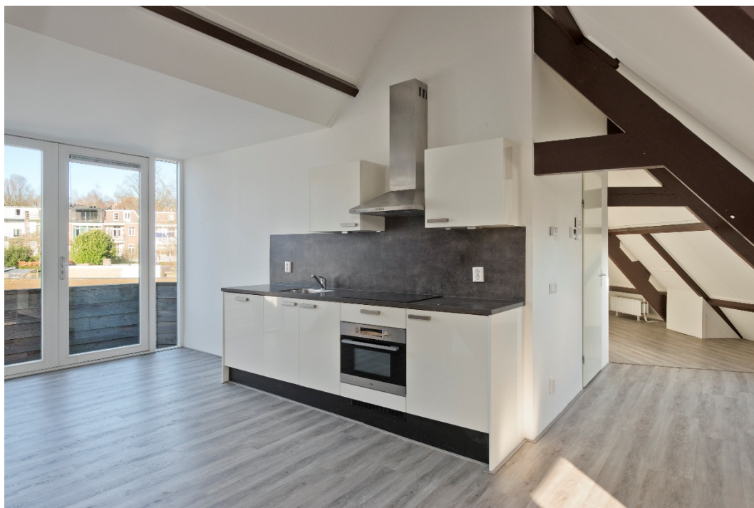
Woonkamer met open keuken