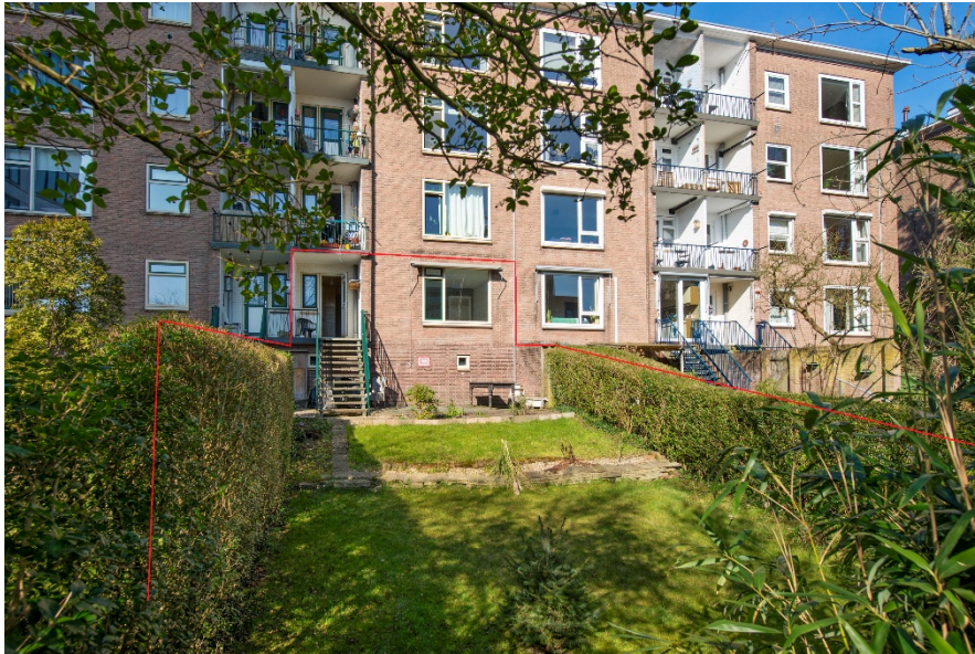
Dr. J.C. Hartogslaan 12-1 te Arnhem Noord