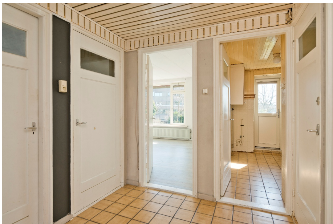
Hal met toilet