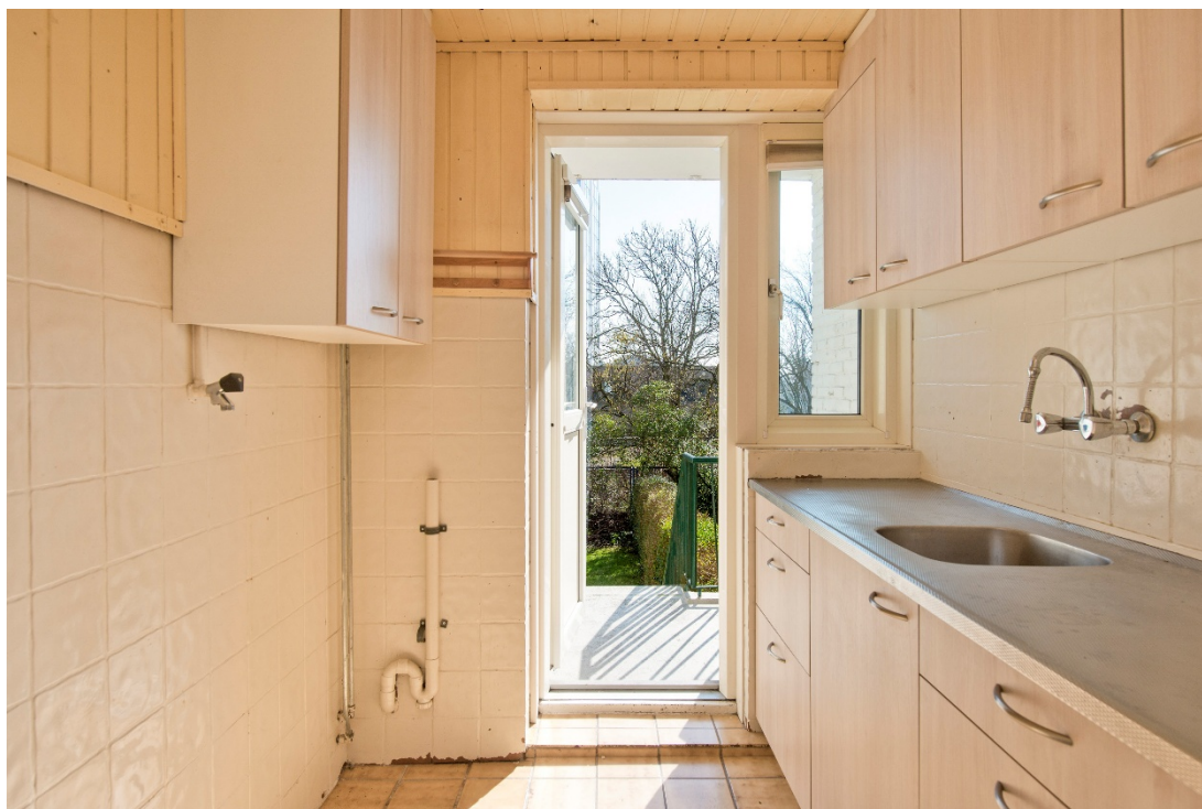
Keuken met balkon en toegang tot de diepe achtertuin

Dr. J.C. Hartogslaan 12-1 te Arnhem Noord