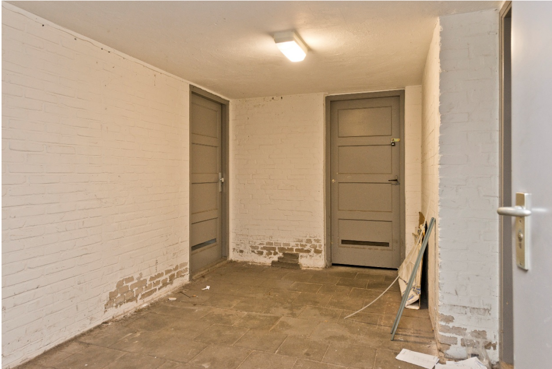
Berging in onderbouw

Dr. J.C. Hartogslaan 12-1 te Arnhem Noord