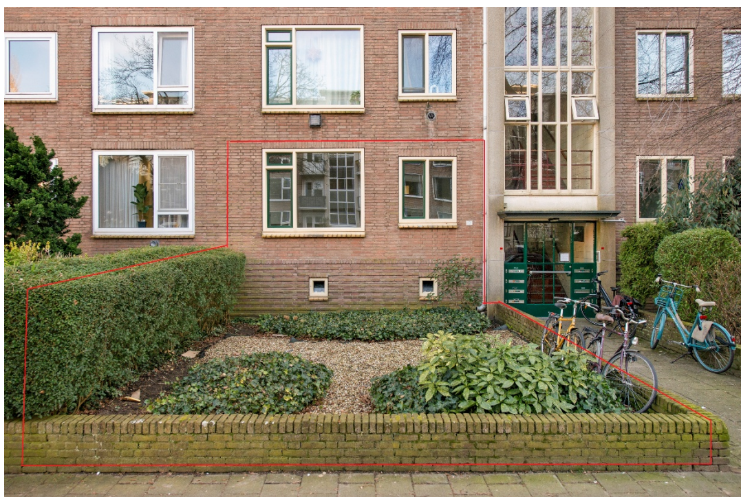
Appartement met voortuin (en achtertuin)