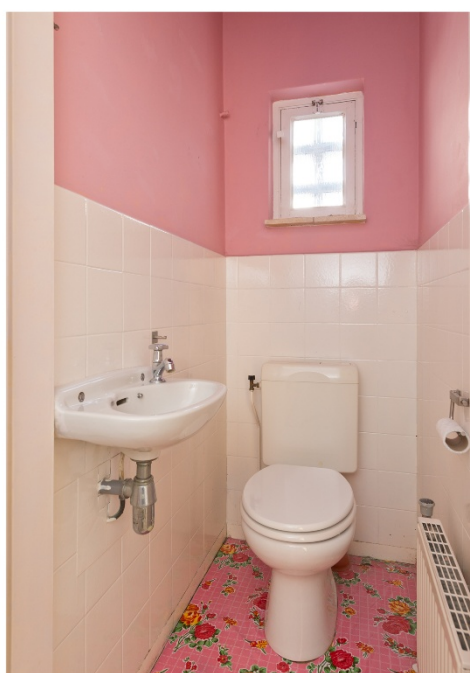
Hal en toilet