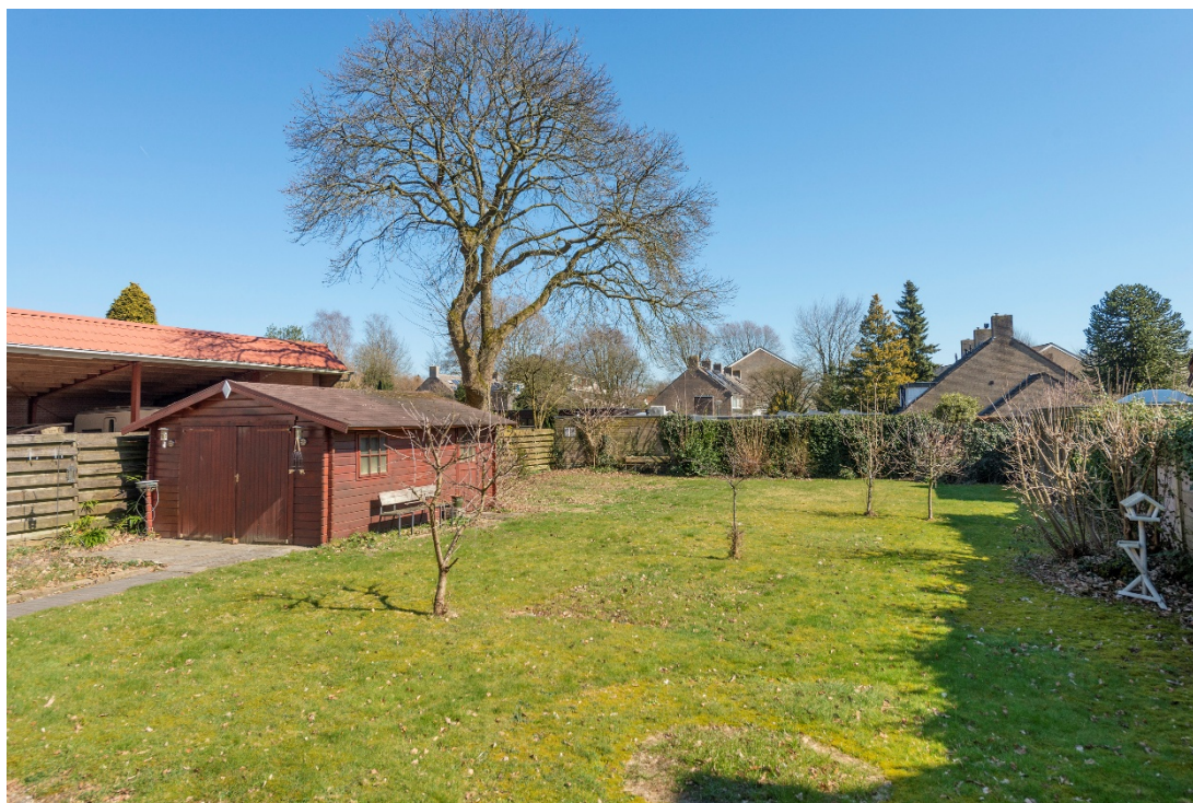
Achtertuin met berging

Van Toulon van der Koogweg 80 te Oosterbeek