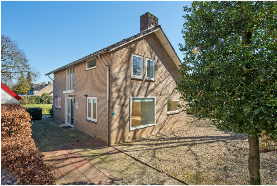
Van Toulon van der Koogweg 80 te Oosterbeek