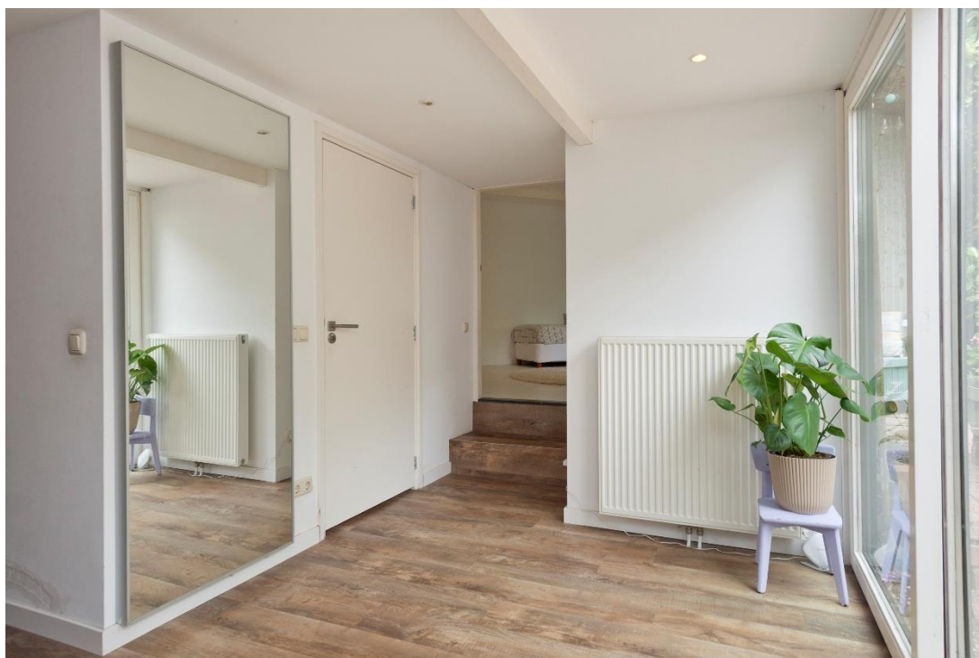
Hal naar slaap-/werk/speelkamer