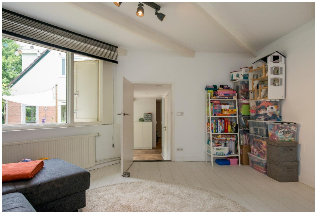
Slaapkamer 1 begane grond