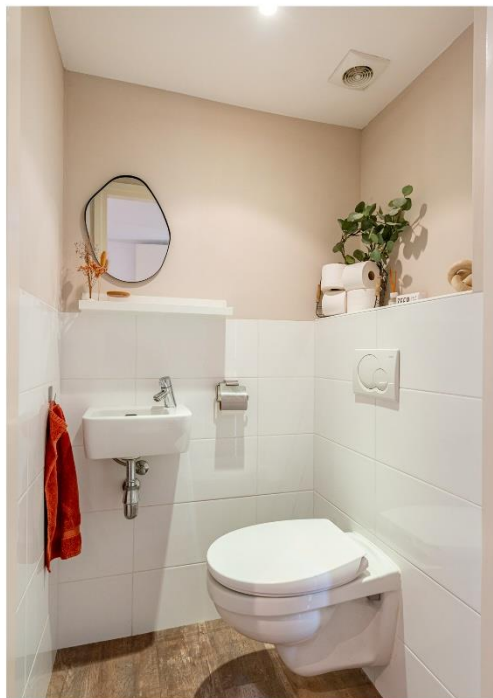
Hal en toilet