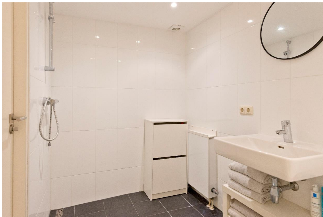
Badkamer 1 op begane grond