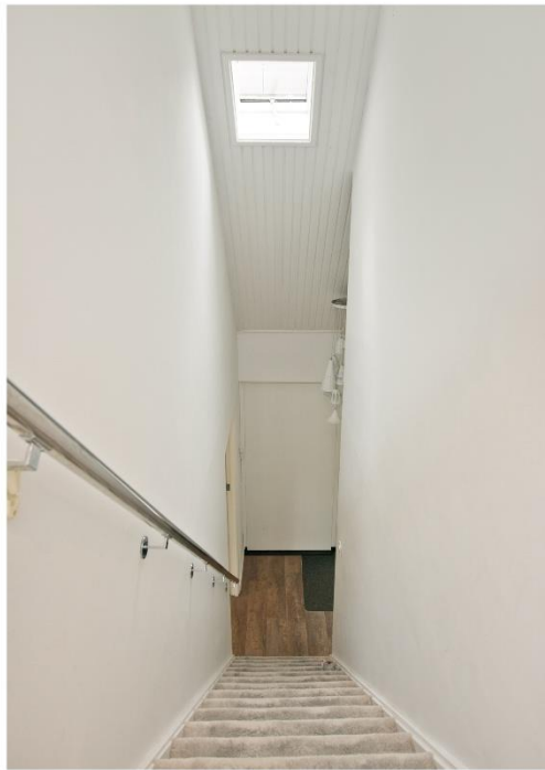
Trap naar 1 e verdieping