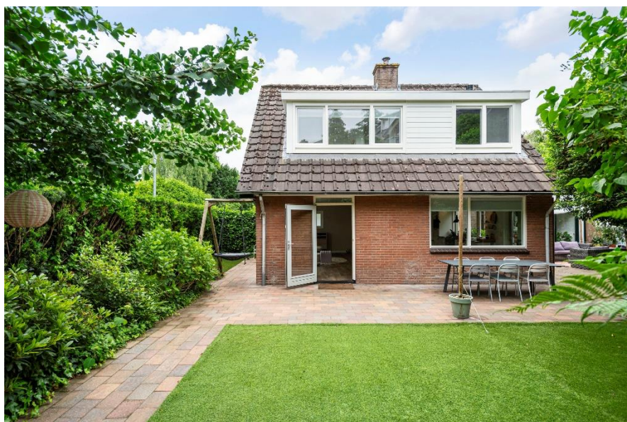
Stortweg 1 te Oosterbeek